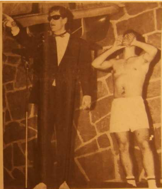
Adjugé 500 francs avec le caleçon !