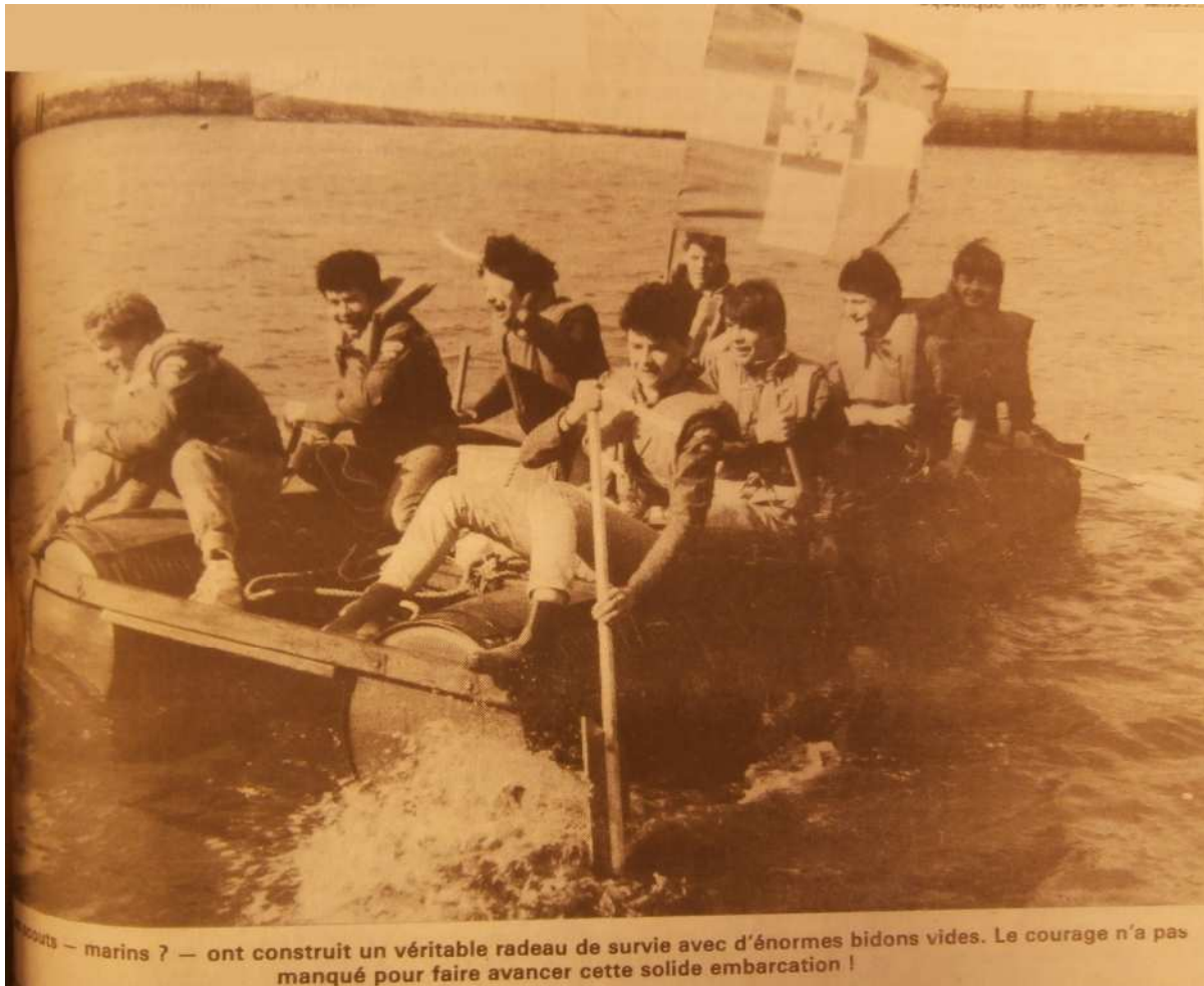
...scouts — marins ? — ont construit un véritable radeau de survie avec d'énormes bidons vides. Le courage n'a pas manqué pour faire avancer cette solide embarcation !